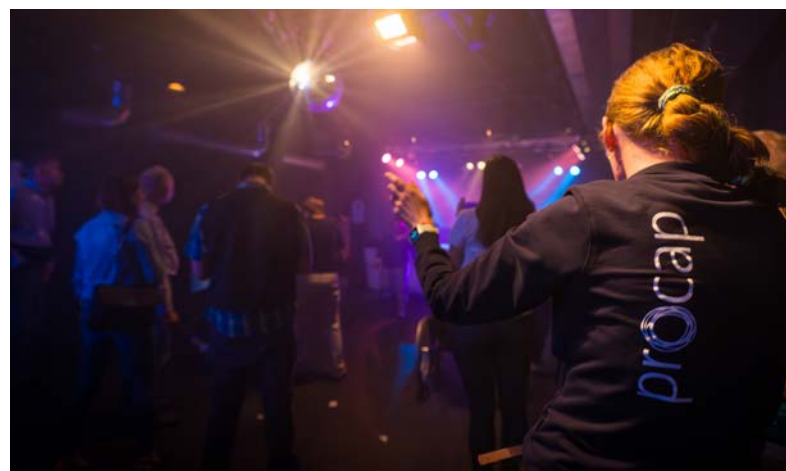
Ab auf die Tanzfläche! Procap trägt dank dem gesammelten Geld die Idee der LaVIVA-Partys in weitere Schweizer Clubs.

Ein riesiger Dank geht an die Mitglieder von Procap, die einen grossen Beitrag zum Erfolg des Projektes geleistet haben. Zudem geht ein Dank auch an Fundpark, einen Ausbildungs- und Integrationsbetrieb, der Procap auf dem Weg der Umsetzung der gesamten Kampagne bis zum Schluss unterstützt hat.