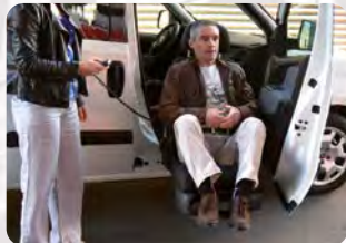
Ein- und Aussteigehilfen