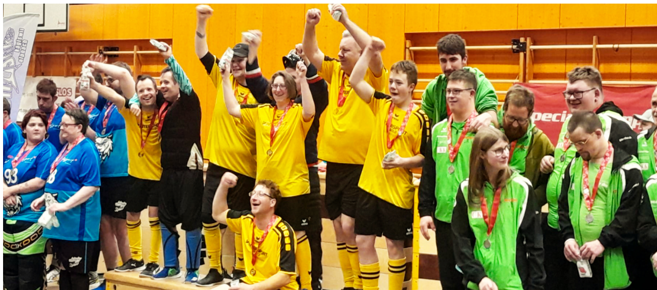
Die „Lotzwiler Chnebler“, das Unihockeyteam von Procap Bern gewinnt am 1. Februar 2025 in Sarnen die Goldmedaille.