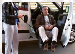
Ein- und Aussteigehilfen